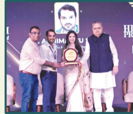
मा. विधान सभा अध्यक्ष एवं पूर्व मुख्यमंत्री- डॉ. रमन सिंह जी द्वारा सम्मानित