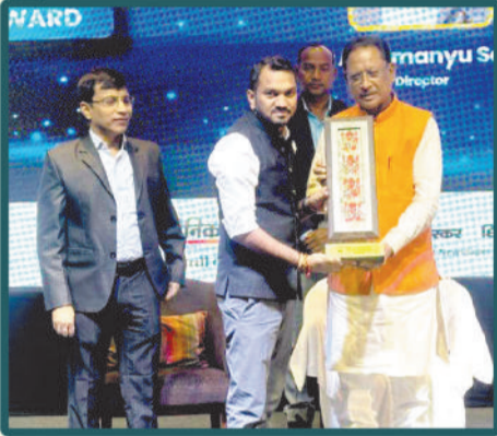
मा. मुख्यमंत्री- श्री विष्णुदेव साय जी द्वारा सम्मानित

छत्तीसगढ़ का पहला सर्वसुविधायुक्त 20 बिस्तरीय आयुर्वेद अस्पताल