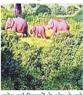
समेत कई किसानों के खेत में लगे धान की फसल को नुकसान पहुंचाया है। दो दिनों तक देवगढ़ में डेरा जमाने के बाद हाथी ग्राम सोनतराई एवं मंगरेलवाड़ से होते हुए मांड नदी पार करके ग्राम धरमपुर पहुंच गए हैं। जहां लिपाइरिया के जंगलों में डेरा जमाए हाथियों ने धान की फसल को काफी नुकसान पहुंचाया है। हाथियों की वजह से

सीतापुर। विगत तीन दिनों से नगर से सटे गांवों के जंगलों में हाथियों का दल डेरा जमाए हुए है। इस दौरान हाथियों के समूह ने खेतों में लगे धान के फसल को काफी नुकसान पहुंचाया है। गांवों के आसपास हाथियों की मौजूदगी से ग्रामीणों में काफी दहशत है। लोग हाथियों से जानमाल की सुरक्षा को लेकर रतजगा करने को मजबूर हैं। वन अमला हाथियों की मौजूदगी पर नजर जमाये हुए है। विदित हो कि हाथियों का दल विगत दो दिनों से नगर से सटे ग्राम देवगढ़ में डेरा जमाए हुए था। हाथियों के इस दल में नर मादा एवं पंडु चरु हैं। जहां लिपाइरिया के जंगलों में डेरा जमाए हाथियों ने धान की फसल को काफी नुकसान पहुंचाया है। हाथियों की वजह से