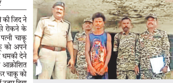
आत्म हत्या करने के लिए धमका रही थी पति को

रील बनाकर इंस्टाग्राम में अपलोड करने की जिद ने महिला की जान ले ली। रील बनाने से रोकने के लिए पति ने घर की लाइट काटी तो पत्नी चाकू लेकर विवाद करने बैठ गई और चाकू को अपने