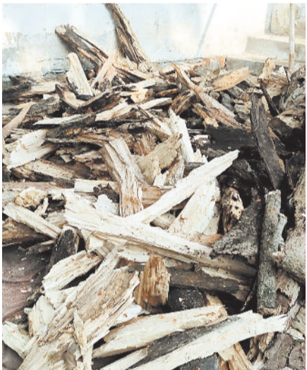
आम की सूखी लकड़ी।