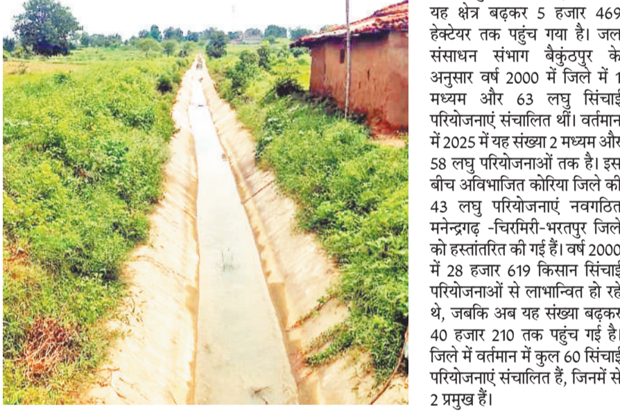
595 हेक्टेयर में रबी फसलों को सिंचाई सुविधा प्राप्त थी, वहीं अब यह क्षेत्र बढ़कर 5 हजार 469 हेक्टेयर तक पहुंच गया है। जल संसाधन संभाग बैकुण्ठपुर के अनुसार वर्ष 2000 में जिले में 1 मध्यम और 63 लघु सिंचाई परियोजनाएं संचालित थीं। वर्तमान में 2025 में यह संख्या 2 मध्यम और 58 लघु परियोजनाओं तक है। इस बीच अविभाजित कोरिया जिले की 43 लघु परियोजनाएं नवगठित मनेन्द्रगढ़-चिरमिरी-भरतपुर जिले को हस्तांतरित की गई हैं। वर्ष 2000 में 28 हजार 619 किसान सिंचाई परियोजनाओं से लाभान्वित हो रहे थे, जबकि अब यह संख्या बढ़कर 40 हजार 210 तक पहुंच गई है। जिले में वर्तमान में कुल 60 सिंचाई परियोजनाएं संचालित हैं, जिनमें से 2 प्रमुख हैं।

छग राज्य के रजत जयंती वर्ष में कोरिया जिले में सिंचाई के क्षेत्र में नई ऊंचाइयां हासिल की हैं। पिछले 25 वर्षों में जिले की कुल सिंचित रकबा में ढाई गुना से अधिक वृद्धि हुई है। वर्ष 2000 में जिले का सिंचित रकबा 18 हजार 13 हेक्टेयर था, जो अब बढ़कर 21 हजार 102 हेक्टेयर तक पहुंच गया है। यदि सिंचाई प्रतिशत की बात करें तो यह वर्ष 2000 में 13.72 प्रतिशत थी, जो अब बढ़कर 34.55 प्रतिशत हो गई है। यह वृद्धि जिले की कृषि व्यवस्था और जल संसाधन प्रबंधन में आए सकारात्मक परिवर्तन को दर्शाती है। रबी फसलों के सिंचाई रकबे में भी उल्लेखनीय प्रगति दर्ज की गई है। वर्ष 2000 में जहां मात्र 3 हजार